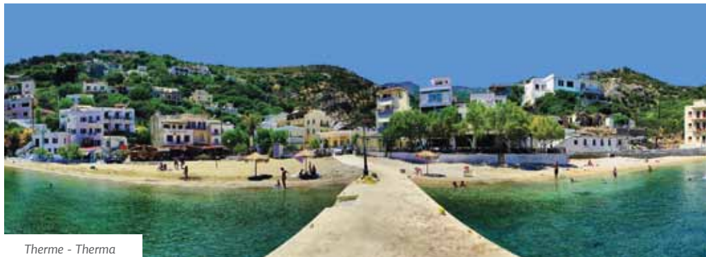
Therme - Therma

Es gibt ebenfalls Strände, die sie besuchen können, alle entlang der Küste von Icaria gelegen. Sandige und mit Steinen, isoliert oder mit vielen Menschen, mit Felsen oder hellblaue, kleine oder große. Die Strände von Icaria sind mehr als 30, alle wunderschön und einzigartig.