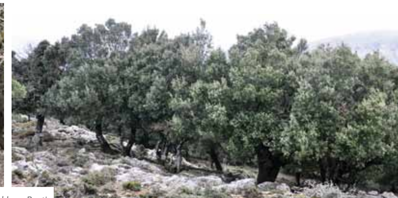
Foresta di Ranti - Wald von Ranti