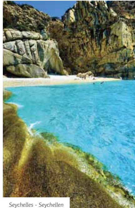
Seychelles - Seychellen

Una spiaggia non organizzata, la quale fu creata parecchi anni fa, da una frana durante la costruzione della strada per e dal villaggio Magganitis. La spiaggia è di ghiaia chiarissima e luminosa, circondata da formazioni rocciose di grande effetto e bagnata da un bellissimo mare color smeraldo, si tratta di un'esperienza indimenticabile! Lasciate la vostra auto e camminate lungo il sentiero per solo 7 minuti che vi porterà forse alla spiaggia più bella dell'isola!