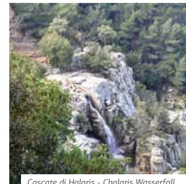
Cascade di Halaris - Chalaris Wasserfall