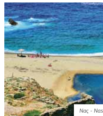
Νας - Nas