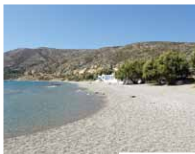
Φάρος - Faros

Η μεγαλύτερη παραλία του νότιου τμήματος του νησιού, που αποτελεί ανερχόμενο τουριστικό θέρετρο. Γραφικές ταβέρνες και καφετέριες, καθώς και πολυάριθμα καταλύματα αναδεικνύουν το Φάρο σε ένα ιδανικό προορισμό για τον επισκέπτη. Αμμώδης αλλά και με μικρά βότσαλα σε ορισμένα σημεία είναι ιδανική για κολύμπι όσο και για θαλάσσια σπορ.