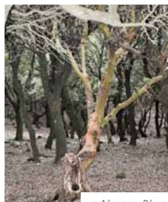
το Δάσος του Ράντη - forest of Ranti

It is located on the west side of the Atheras mountain range, covering an area of almost 15 square km, which is actually a major part of the total forest area on the island. It is more than 200 years old and is thought to be the oldest forest in the area of the Balkans. It is included in NATURA 2000, while lately it has become a major attraction for nature lovers.