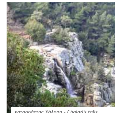
καταρράκτης Χάλαρη - Chalaris's falls