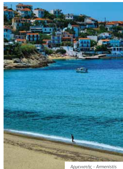
Αρμενιστής - Armenistis