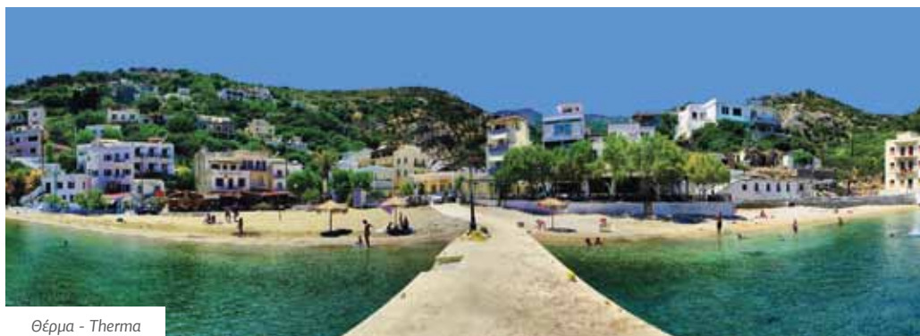
Θέρμα - Therma

There are beaches along the whole coastline of Icaria waiting for you to discover them. Sandy or with pebbles, isolated or crowded, with rocks or crystal blue water, small or bigger, there are more than 30 beaches in Icaria and they are all wonderful and unique.