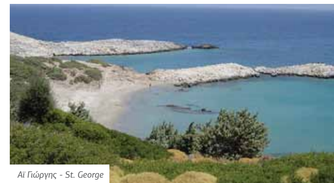
Αϊ Γιώργης - St. George