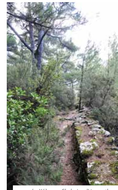
μονοπάτι Χάλαρη - Chalaris walking path