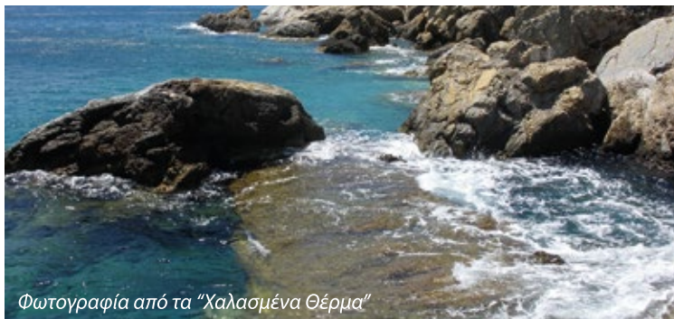
Φωτογραφία από τα "Χαλασμένα Θέρμα"

Γ ύρω στο 750 π.Χ., αναφέρεται η πρώτη εγκατάσταση Μιθησίων στα Θέρμα.