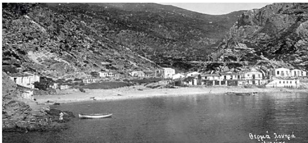
Θέρμα λουτρό Ικαρίας

Γύρω στο 200 π.Χ., λόγω γεωλογικών γεγονότων, όπως αναφέρουν οι επιστήμονες, ένα μεγάλο μέρος της πόλης καταβυθίστηκε. Το γεγονός αυτό πιστοποιεί η εύρεση τμημάτων αρχαίων δόμων στο βυθό της θάλασσας. Η περιοχή μέχρι σήμερα ονομάζεται «Χαλασμένα Θέρμα». Δίπλα στα αρχαία Θέρμα, αναπτύχθηκε και λειτουργεί η νέα λουτρόπολη «Θέρμα Ικαρίας».